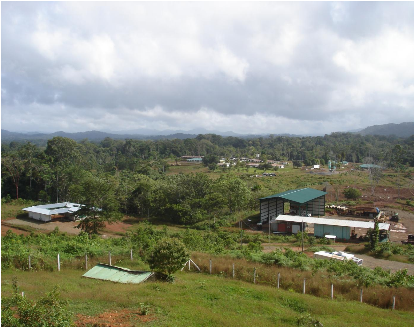
Primeras instalaciones en Crucitas previas a la explotación

Muchas veces, el conflicto entre la humanidad y la naturaleza no es nada más que una extensión del conflicto entre seres humanos y, a no ser que el movimiento ecológico tome en cuenta el problema de la dominación en todos sus aspectos, no podrá realmente contribuir a la erradicación de las causas principales de la crisis ecológica. Ésta es una crisis común que afecta a todos los seres humanos y que requiere romper las divisiones sociales. Sin embargo, el problema principal radica en que la acción común no necesariamente podrá aproximarse a las soluciones, debido a que las clases políticas y económicas que causaron gran parte de la situación actual son las que detienen este mismo poder y bloquean el proceso de búsqueda de soluciones, y debido también a su insuficiente inclinación en cambiar su actitud y el rumbo de la carrera para la acumulación de bienes.